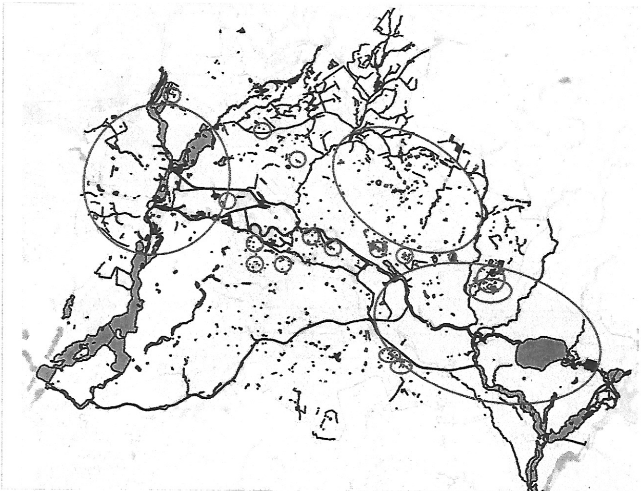
Abb. 4 Vorgeschlagene Maßnahmen (rot umrandet), überwiegend zur Grundwasserabsenkung (im Urstromtal), sonst durch Drainagen (auf der Barnim-Hochfläche) (Im Urstromtal wurden neben der projektierten Anlage im Boxhagener Quartier zehn weitere gleichartige Anlagen angesetzt.)

Das bedeutet „Ewigkeitskosten“ von ca. 95 Mio. pro Jahr .